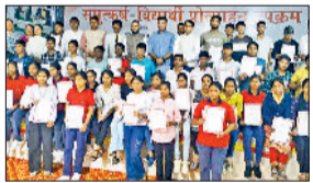
कनीना। विद्यार्थियों को सम्मानित करते हुए।