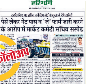
नारनौल। 26 अक्टूबर को प्रकाशित समाचार।