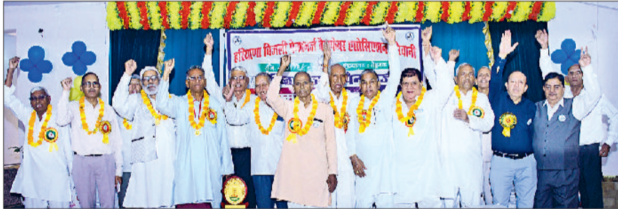
बिजली पैशनर्ज को सम्मानित करते अतिथि।