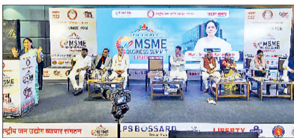
भिवानी। समारोह को संबोधित करती एक वक्ता।

केंद्रीय सूक्ष्म, लघु और मध्यम उद्यम मंत्री शोभा करदलाल ने कहा कि एमएसएमई में कुछ भी बनाएँ, हमारा लक्ष्य एक्सपोर्ट के लिए क्वालिटी की चीजों का उत्पादन होना चाहिए। विदेशों में नेचुरल और फर्टिलाइजर रहित चीजों की डिमांड है। इसका हमें ध्यान रखना होगा। साथ ही उन्होंने कहा कि देश के छोटे उद्योगों को बढ़ावा देने के लिए प्रधानमंत्री नरेंद्र मोदी काम कर रहे हैं। यह बात उन्होंने रविवार को यहां लीला होटल में राष्ट्रीय जन उद्योग व्यापार संगठन की ओर से आयोजित एमएसएमई बिजनेस समिट एवं उद्यम अवार्ड समारोह को संबोधित करते हुए कही।