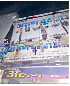
महेन्द्रगढ़। शॉपिंग कॉम्प्लेक्स में इस दुकान में लगी थी आग।

महेन्द्रगढ़। क्षेत्र में दो जगह आगजनी की घटना सामने आई है। दमकल के कर्मचारियों ने दोनों जगह पर मौके पर पहुंचकर कड़ी मशक्कत के बाद आग पर काबू पाया। क्षेत्र में इन दिनों आगजनी की घटना लगातार सामने आ रही है। वहीं फायर कर्मचारी भी सूचना मिलते ही लगातार आग पर काबू पा रहे हैं। बीते दिनों गांव निम्बहेड़ा व माजरा चुंगी के पास अरावली स्कूल के पास भी किसान के खेतों में आग लग गई थी। घटना में किसानों की कड़वी जल गई थी। शनिवार को भी एक घटना महेन्द्रगढ़ शहर व दूसरी घटना गांव सुंदरह में हुई। दोनों स्थानों पर दमकल विभाग की गाड़ी ने मौके पर पहुंचकर आग पर काबू पाया।