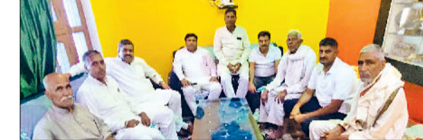
महेंद्रगढ़। गांवों का दौरा करते हुए।

उत्तर प्रदेश- 24 व पंजाब से एक वार शहीद था। एक परमवीर चक्र एवं आठ वीर चक्र एवं छह सेना मेडल से नवाजे गए इन महान वीरों को भारत सरकार ने शूरवीरों में अति शूरवीर वीर अहीर खिताब से नवाजा। उन्होंने बताया कि 31 अक्टूबर को राजस्थान-हरियाणा सीमा पर हरियाणा यादव महासभा के पदाधिकारीगण राजस्थान यादव महासभा के पदाधिकारियों से कलश ग्रहण करेंगे। एक नवंबर को अहीरवाल की राजधानी रेवाड़ी शहर में रेजांगला स्मारक पर शहीदों को नमन एवं युद्ध वीरगानाओं का सम्मानित कर कलश यात्रा पूरे शहर का भ्रमण करेगी। दो नवंबर को महेंद्रगढ़ के चाल पैलेस पर शहीदों को नमन एवं सभा व युद्ध वीरगानाओं को सम्मानित कर राव तुलाराम चौक से पूरे शहर का भ्रमण करते हुए ग्राम मालडा होते हुए ग्राम झूक में यात्रा का समापन होगा। तीन नवंबर को नारनौल के नसीबपुर युद्ध स्मारक से यात्रा शुरू होकर शहर का भ्रमण करते हुए यादव धर्मशाला में एक सभा के साथ कलश यात्रा का समापन होगा।