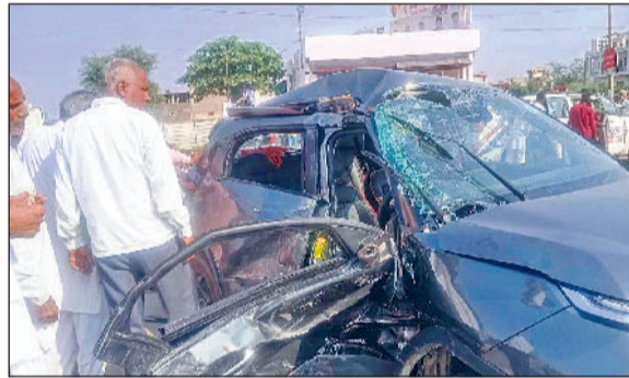
महेन्द्रगढ़। हादसे के बाद क्षतिग्रस्त गाड़ी व ट्रक पलटने के बाद नीचे बिखरे पड़े सीमेंट के कट्टे।

प्लाईओवर के पास ट्रक चालक व पंच गाड़ी की आपसी भिड़ंत हो गई। जिससे ट्रक चालक व गाड़ी चालक गंभीर रूप से घायल हो गए। राहगीरों ने एंबुलेंस की मदद से चारों को नागरिक अस्पताल पहुंचाया। जहां पर चिकित्सकों ने तीन लोगों को प्राथमिक उपचार देकर हायर सेंटर के लिए रेफर कर दिया। टक्कर इतनी जबरदस्त थी कि कार पूरी तरह क्षतिग्रस्त हो गई, इसके साथ-साथ टक्कर लगने से सीमेंट से भरा ट्रक पलट गया तथा कट्टे इधर उधर बिखर गए। हादसे के बाद मौके पर भारी भीड़ जमा हो गई और लोगों ने तुरंत डायल 112 पर सूचना दी।