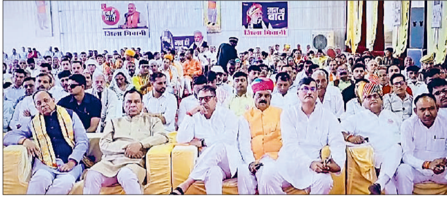
भिवानी। पीएम नरेंद्र मोदी के मन की बात सुनते नेता।