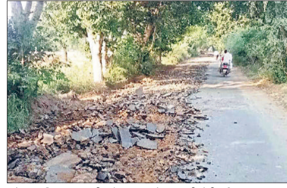
महेंद्रगढ़। विभाग द्वारा बुडीन से बलाघाटा मोड़ तक की तोड़ी गई सड़क।

■ 4.44 करोड़ की लागत से खातोद तक बनाई जाएगी नई सड़क. राजस्थान से मजबूत होगी जिले की कनेक्टिविटी