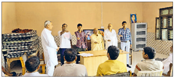
भिवानी। चुनाव के बाद शायत लेते पदाधिकारी।